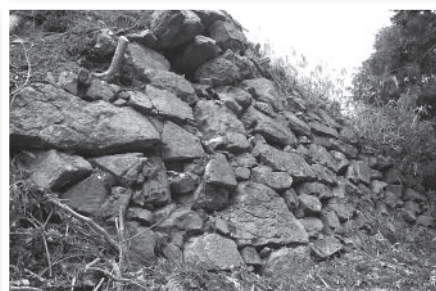
▲水口岡山城跡 (水口)