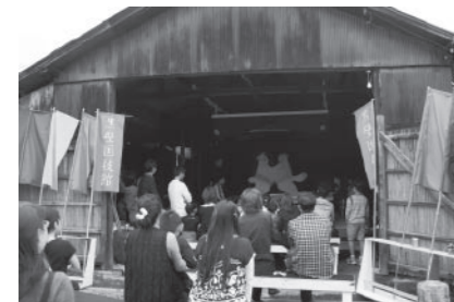
▲黒壁国技館の狸相撲では千秋楽(11月23日)に王座決定戦を開催