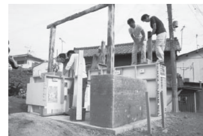
▲出来上がりが楽しい版楽小屋