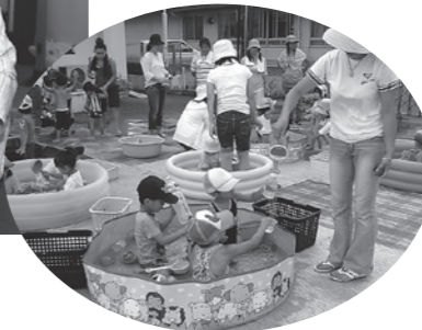
各地域で子育て支援事業を実施