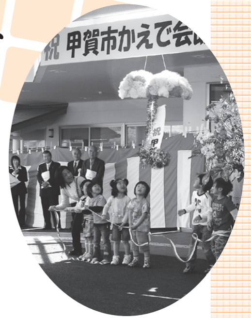
かえで会館がリニューアルオープン