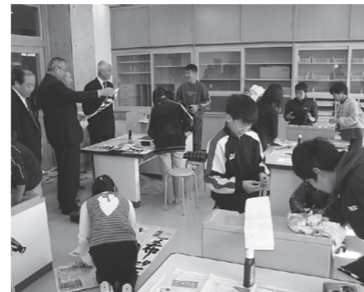
小原小学校での授業風景