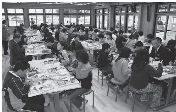
貴生川小学校での給食風景