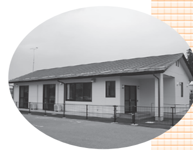
新しく建設された大野児童クラブ