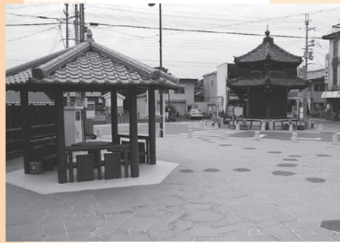
市民の集いの場を整備(六角堂広場)