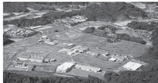
企業立地が進む市内の工業団地