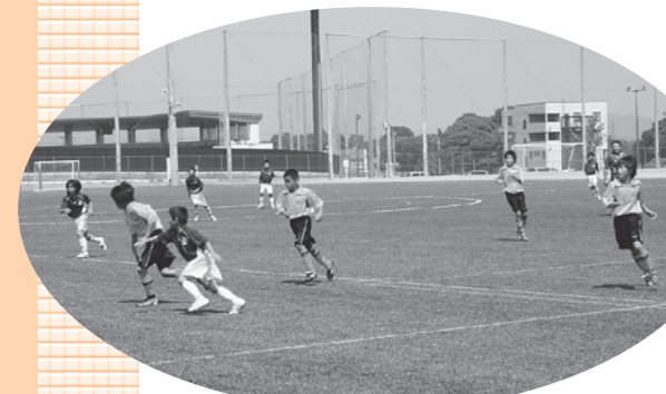
昨年8月に供用開始した多目的グラウンド