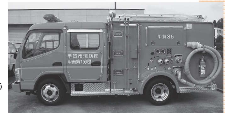
新しく購入した水槽付消防ポンプ車