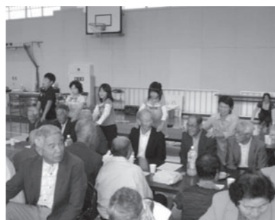
このほど、羽ばたけ鮎河自治振

ニシクラメン、デージーなどが植えられました。作業は近所の方が様子を見に来てくださったりして、和気あいあいとした雰囲気で行われていました。 自治振興会の役員の方は、「世話は大変ですが、冬に向けて、葉ボタンやパンジーも出てくるので、プランターを増やしていきたいですね。」と話しておられました。 本施設は公民館の貸館もあり、毎月1,000名以上の方が利用されています。これからの季節、来訪される皆さんを楽しませてくれることでしょう。