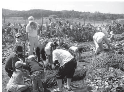
信楽地域市民センター