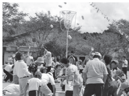
甲南第三地域市民センター

農業を通して子どもから高齢者までみんなが元気になれるまちづくりをめざそうと集まった仲間たちが江友会（えいゆうか）の活動です。 信楽学区自治振興会神山・江田分会青少年育成部会と合同で9月10日、春に植えたサツマイモの収穫が行われました。この日は子どもたち20人ほどの参加があり、秋空のもと、一生懸命がんばり清々しい汗をかきました。 今後は、収穫したもち米や稲わらを使った「もちつき大会」や「しめ縄づくり」を計画されています。