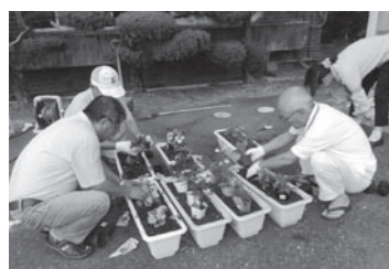
このたび貴生川地域自治振興会環境部会の活動で、貴生川地域市民センターの玄関口に10個のプランターが置かれました。