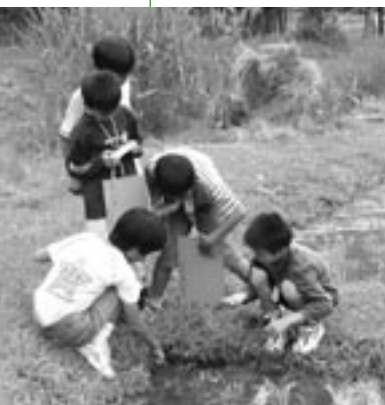
㊧ 昆虫広場で水中の生き物の観察