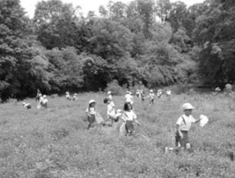
㊦ レンゲ畑で自然観察をする子どもたち