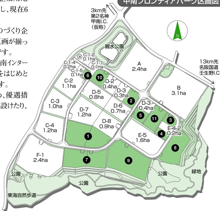
甲南フロンティアパーク区画図

県など関係機関との連携による立地促進協議会を組織するなど、市の経済発展と地域活性化に向け優良企業の早期立地に取り組んでいます。