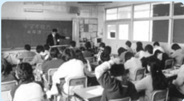
▲ 小学校での市職員による租税教育風景

なお、自主的に納付するわずらわしさや、うっかり納め忘れることのないよう、口座振替・自動払込をおすすめしますので、ご利用ください。