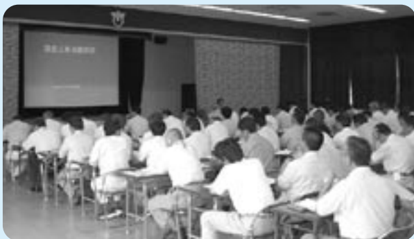
▲ 請負工事成績評定の様子

管理部門として、庁内経費の節減に努めるとともに、予算全般にわたって見直しをして、将来の明るい健全な財政を構築したいと考えています。