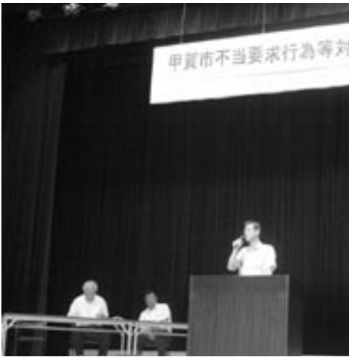
▲甲賀警察署から管内の実態についての講話

そこで不当要求行為に対する対応を身につけてもらうため職員研修を行いました。研修では甲賀警察署から管内での不当要求行為の実態についての話を聞いた後、実際に不当要求行為が起こった場合の対応を