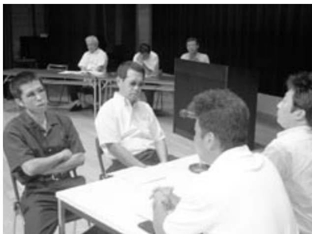
▲県警職員による迫真の演技