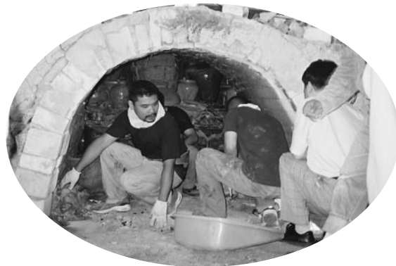
▲ 窯出し作業は終始、屈みながら。昔の人も大変だっただろう

この穴窯で作品を焼こうと持ち込まれた点数は75人の壺・鉢・皿など約500点。9月1日、2日にかけて窯詰め、左右両方の炎道の奥から同時に詰められました。作品の安定性を求めるため「馬の爪」は使わず、棚板も用いられました。昔の焼き方を忠実に再現しようと