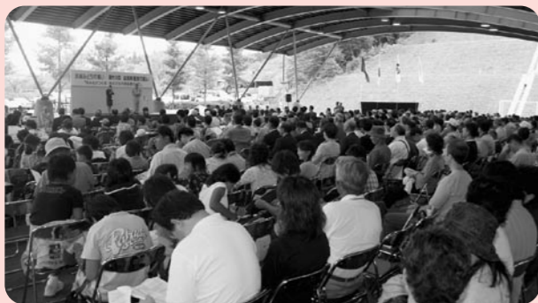
信楽で開催された滋賀県植樹の集い

おかげさまで市民の皆様から4,829,448円、市内企業12社からも88,000円の募金が集まりましたが、この浄財は、学校・公園や街路などの緑化や環境林の整備、「みどりの少年団」活動の資金に役立たせていただきます。