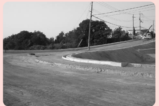
市内で市道の改修が進んでいます

今後、市における建設事業については甲賀市総合計画に基づき整備計画の策定を行い、より計画的な整備を進めていきたいと考えています。