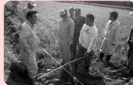
道路用地の立会いをしています

皆さんが利用する道路や河川などの公共スペースに、使用しなくなった自動車や自転車、テレビなどの電化製品、ゴミなどが不法に投棄されていることがあります。これは、道路や河川の景観を著しく損なうだけでなく、通行の妨げになり、川の流れを悪くします。みんなでいつも美しい道や川を守りましょう。