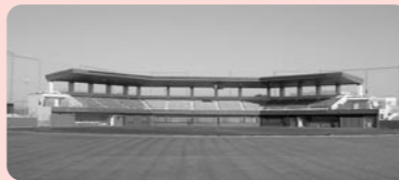
4月にオープンする甲賀市民スタジアム

【問合せ先】 計画係 ☎65-0719 } FAX 63-4601 公園緑地係 ☎65-0720 } 区画整理係 ☎65-0721 }