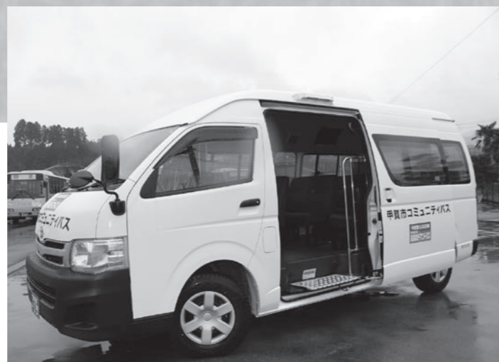
▲デマンドバスとして運行する小型車両

今後、その運行結果を基に甲賀市に適したコミュニティバス体系の検討を進めていきます。