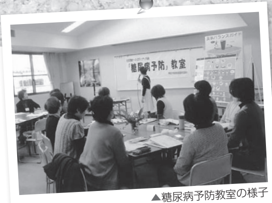
▲糖尿病予防教室の様子

国の調査結果より、滋賀県は糖尿病になる人が多いことから、信楽町で糖尿病予防教室を開催しました。40～70歳の男女合わせて29名の方が参加されました。 教室では糖尿病を予防するには食生活や運動が大切であることを説明しました。その後、調理実習で、1食分の適量を伝え、またエネルギーを消費するための運動を行いました。