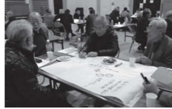
▲中間報告会でのワークショップ

月に1回開催する理事会には、理事も出席し、事業内容も監査しています。また、中間報告会を開催し、年度前半の活動報告やワークショップなどを行っています。