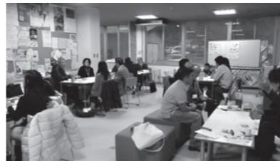
▲外国人住民交流会で親睦を深める

多層にわたる住民の方々の参画を目的に、諸団体とのネットワーキングも進めています。今年度は多文化共生の視点で外国人住民の方々とのつながり活動も開始しました。