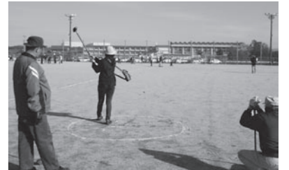
▲かしわざ自治振興会とのブランドゴルフ交流会

持続可能な自治振興会とするため、今年度総会時の基調講演でまちづくり計画の策定について学びました。また、他団体のワークショップを見学し、手法の一つも学びました。