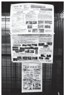
▲会報をごみ集積所に掲示し情報共有を図る

この地区は18の区・自治会で構成されています。特徴としては、区・自治会組織率が約40%と低く、面積は宅地が全体の57%を占めており、住宅地、商業地、工業地の占める率が多い地域です。また、水口町の城下町・宿場町の一端を担っています。このような環境のもと、6つの部会(健康・福祉、文化・スポーツ、環境、安全、事業、区長)を構成し、年度計画に基づき取り組んでいます。