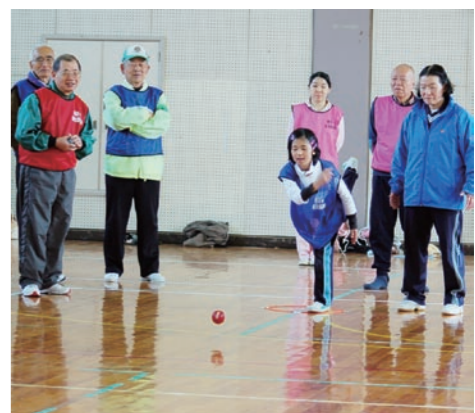
スポーツ祭 in 希望ヶ丘2013

自分たちのまちを住みよいまちにするには、地域に住む皆が一体となつてまちづくりを進めていく必要があります。そこで、地域の皆さんを中心に各種団体をはじめ多くの方々に参画をいただき、把握している地域の諸問題、アンケート結果などをもち、希望ヶ丘の未来を創るまちづくり計画を作成していく予定です。今後地域住民や地域内外の各種団体との連携を広く呼びかけながら、希望ヶ丘地域がより住みよいまちになるように様々な事業に取り組んでいきます。