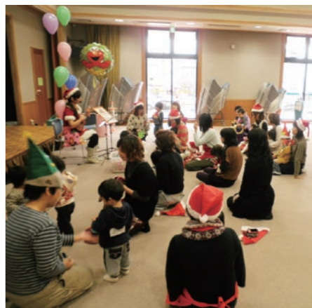
ここにこサークルの様子

従来からの事業に加えて、皆さんの要望などを聞きながら新しい事業にも取り組んでいます。