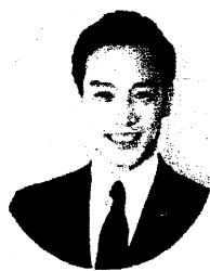
南出 賢一 (大阪府和泉大津市市長)