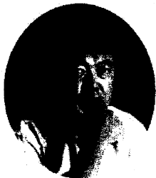
青山 まさゆき (前衆議院議員・ 前厚生労働委員会委員・弁護士)