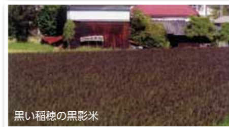
黒い稲穂の黒影米

忍者餃子は、このお米の米粉で皮を練り上げた真っ黒な餃子です。その見た目とジューシーなおいしさで、数々の賞を受賞しています。