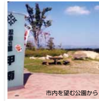
市内を望む公園から