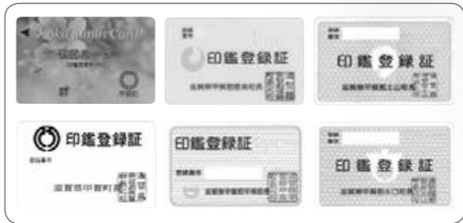
▲旧町のカード6枚 (甲賀二種類)

市では、旧町で発行された写真の「印鑑登録カード」をお持ちの皆さんに「こうか市民カード」(印鑑登録者識別カード)への交換をお願いしています。(旧カードからの交換手数料は無料) お得で便利な自動交付機が利用可能に 「こうか市民カード」に暗証番号を登録すると自動交付機を利用して、休日・夜間*も印鑑登録証明書・住民票・住民票記載事項証明の交付を受けることができます。