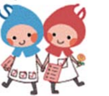
滋賀県の健康づくりキャラクター しがのハグ&クミ