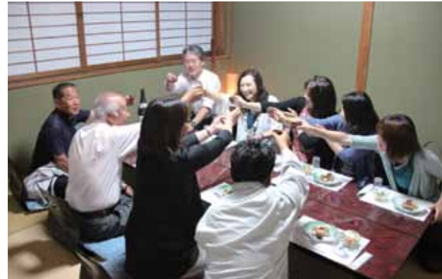
▲甲賀の地酒で乾杯

自慢の料理とともに甲賀の地酒などが用意され、賑やかな乾杯の掛け声は一軒、二軒、もう一軒と続きました。