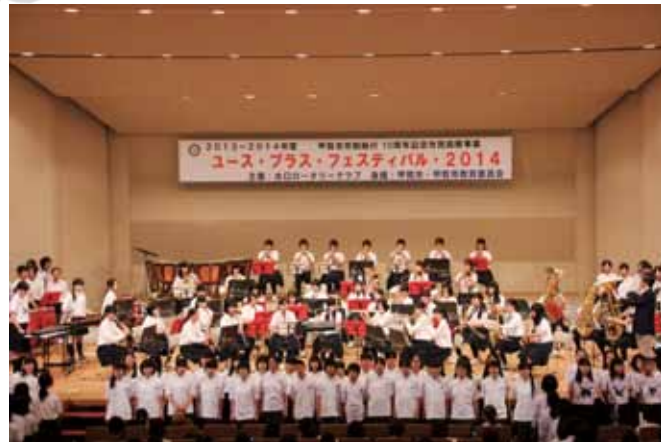
▲全員で「上を向いて歩こう」を合唱

水口ロータリークラブ主催「ユース・プラス・フェスティバル2014」が6月8日、あいのこが市民ホールで開催され、市内7つの中学校の吹奏楽部が日頃の練習の成果を披露しました。 市制施行10周年記念事業の特別企画として、各中学校の3年生部員で構成された合同バンドによる演奏も披露され、最後は「上を向いて歩こう」の曲に合わせて全員が合唱し、満員の会場は一体となって盛り上がりました。