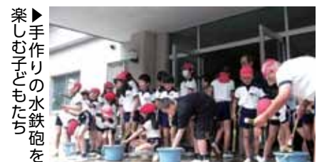
▶手作りの水鉄砲を楽しむ子どもたち

みんなで楽しんだ後は、子どもたちから感謝の気持ちを込めて、肩たたきのお礼。参加した皆さんが笑顔いっぱいになった貴重な機会となりました。