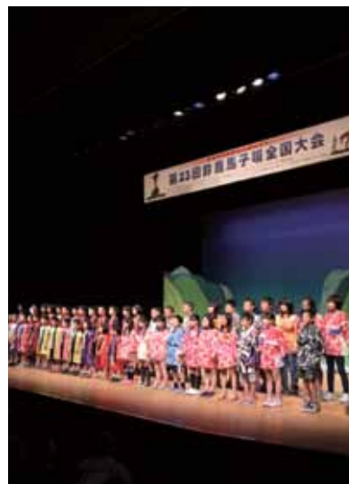
▲馬子唄を合唱する小学校児童