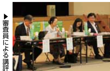
審査員による講評