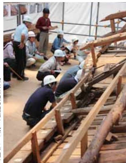
▶解体修理の現場を見学する参加者

昨年度から解体修理工事が行われている、県指定文化財の檜尾神社（甲南町池田）で6月8日、現場見学会が開催されました。 宝永3年（1706年）に建立された本殿は建物が傾き、木材や屋根の檜皮葺が破損したり、塗装・彩色の剥離が進んでいることから、約300年ぶりに全ての部材を解体、修理するとともに、基礎の発掘調査や耐震補強も行われ、平成28年度の完成を目指しています。 往時の極彩色が施された本殿の鮮やかな姿を見られる日が待ち望まれます。