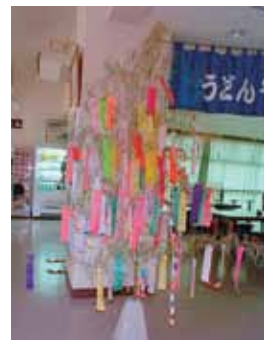
▲昨年の七夕笹飾りの様子

道の駅「あいの土山」では、毎年七夕の節句にあわせ、訪れていただいた皆さんの願い事を短冊に書いていただく「七夕笹飾り」が開催されています。