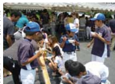
▶昨年の流しそうめんの様子

7月20日、かしわぎ自治振興会と柏木青少年育成会の共催で、「みんな、あつまれ！青少年のひろば」が開催されました。