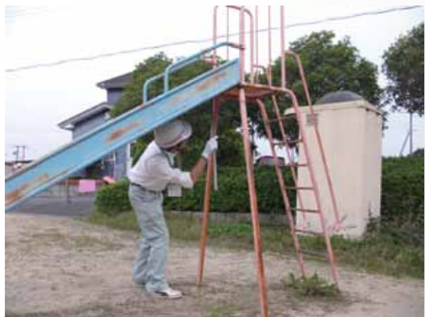
市職員による一斉点検

子ども達の活動・遊びの場となる施設や野外公園283カ所について、夏休み前に一斉点検を実施し、危険箇所の点検・修理を行います。