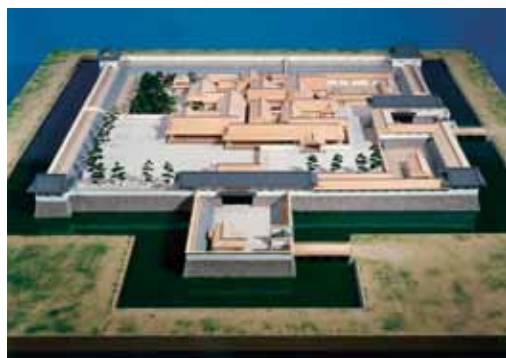
▲水口城本丸復原模型(水口城資料館蔵)

天和二年(1682)に加藤友が入部し水口藩が成立しましたが、加藤氏は水口城拝領以降幕末まで、本丸御殿を加藤氏自らの殿舎や藩庁として利用しませんでした。