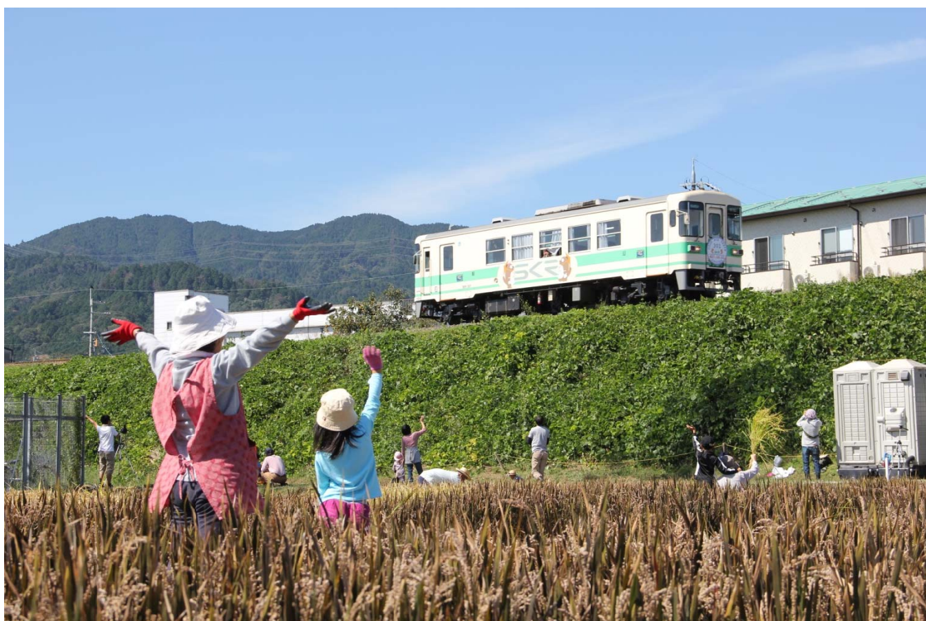
うしかい田んぼアート会場より、引退したSKR301号を望む