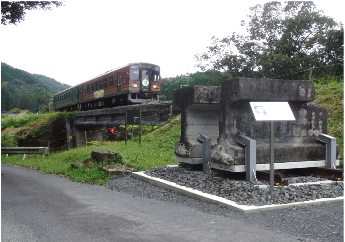
(重要文化財に指定された第一大戸川橋梁・標準桁とSKR車両)