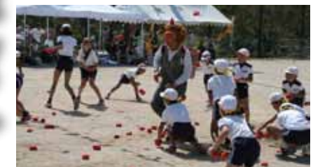
▲きれいになった運動場で運動会

山内小学校は全校児童33人と、以前に比べて大変少なくなり、最近では広い運動場の管理が十分にできない状況でした。そこで、さわやかな秋晴れの下、9月21日に小学校の先生や児童、保育園の保育士さんと、地域の皆さん総勢179人が運動場の草取りボランティアに集まり、運動場を一行に並んでの草取りと周辺フェンスに絡んだツル切りを行いました。皆さん手際よく作業が進み、隅から隅までみるみる草がなくなり、綺麗になってよかったです。「運動会が楽しみやなあ」といった声が聞こえてきました。 また、翌週の28日には学区民運動会が開催され、かわいい保育園児の演技や日頃の成果を発揮する小学生、そして白熱した戦いを繰り広げられた地域の方々。笑顔あり、感動ありの運動会となりました。