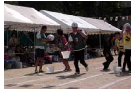
▲バケツの水をこぼさないようにすばやくバトンタッチ！

素晴らしい秋空の下、朝宮学区体育大会が、9月21日に朝宮小学校グラウンドで開催されました。今年度は、地区対抗種目として「防災バケツリレー」が新たに設けられました。地域の多数の皆さんが参加される運動会で、防災意識と自助、共助といった地域防災力の向上と啓発を目的とし、運動会を主催する朝宮自治振興会・青少年育成部会において考案されました。 地域の運動会が、防災を切り口としたコミュニケーションの場となり、競技で楽しく盛り上がりながら、防災を意識する時間を共有することで、地域防災の輪が広がってほしいと思います。