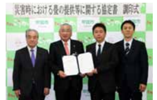
▲協定書への調印式