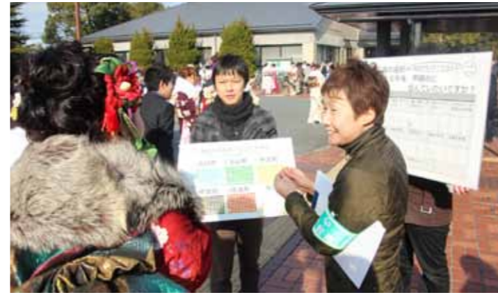
▲成人式における若者定住アンケートの様子

迫りくる人口減少社会において、生産力・消費の衰退による経済活力の低下、農山村地域の過疎化の進展、地域コミュニティの弱体化など先の見えない不安が広がっています。そうした中、国が掲げる地方創生を活用しながら、人口減少に立ち向かい、元気なこうかを創るため「甲賀の國づくりプロジェクト」として、本市独自の取り組みを積極的に展開します。