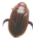
コシマゲンゴロウ