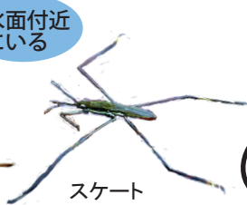
アメンボ のなかま