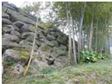
▲大溝城 天守台の石垣

水口岡山城跡城郭歴史フォーラム 「水口岡山城と大溝城 移築年代をめぐって」 日時 9月27日(日)13時30分～16時30分(開場13時) 場所 甲賀市碧水ホール