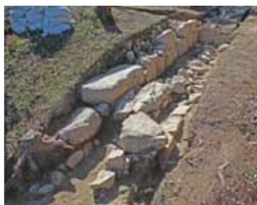
▼水口岡山城 推定天守台の石垣

なお、同日は会場横に一般社団法人水口岡山城の会が天守型バルーンを設置します。往時の姿を想像する良い機会となるでしょう。