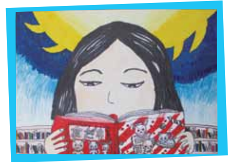
本の好きな女の子