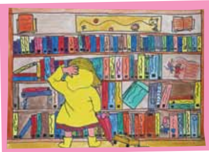
こびとの住む本だな

このコーナーでは、市内の保育園・幼稚園・小中学校の児童や生徒が描いた絵を順次紹介していきます。