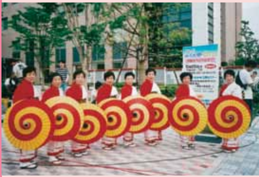
▲江州音頭の衣装に身を包むメンバー