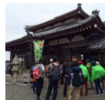
▲少人数での説明が好評だったボランティアガイド(長福寺で)

参加者は、甲賀駅から国指定文化財で国内最大級の木造十一面観音坐像がある櫛野寺までの約4kmを