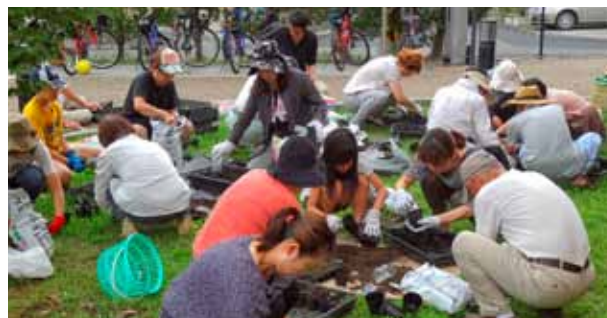
▲花の苗づくりをするボランティアの皆さん

希望ヶ丘学区自治振興会では、地域内の環境美化と住民相互の交流を目的として、道路脇の花壇に花を植える「花いっぱい活動」を実施しています。 最初は希望ヶ丘地域を対象に4人ほどで始めた事業でしたが、今では50人以上に増え、学区内のメイン道路沿いを中心に、春はパンジー、夏にはミニトマト、秋から冬にかけてはハボタンなど、季節の花を植えています。種から育てて苗を作ったり、四季を通して花を途絶えさせないようにするのが大変ですが、道行く人々を楽しませるため、ボランティアの皆さんが努力されています。