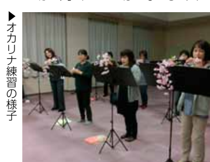
▶オカリナ練習の様子

オカリナ演奏を通じて小原地域で活動するサークル「スイトピー」は、音楽好きの素敵な女性が集まり、結成6年目を迎えます。講師の指導を受けながら日々の練習を重ね、レパートリーを増やし、自治振興会主催のふれあいコンサートなどに出演してこられました。両手に納まる小さなオカリナから出る音色は、優しくどこか懐かしく心が癒やされます。