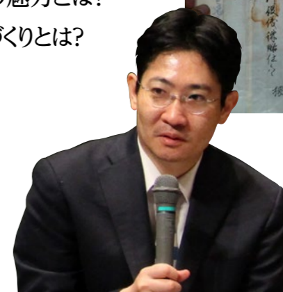
◀歴史学者 磯田道史氏