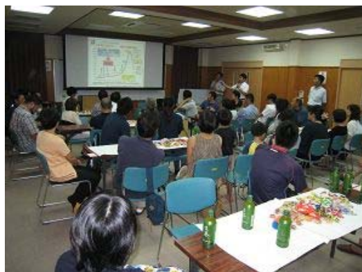
H28.8.26 おしゃべりサミットin神山・江田