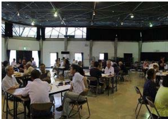
H28.7.24 綾野学区 ぶっちゃけ談義