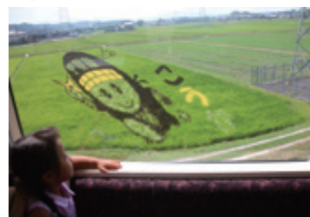
▲昨年の田んぼアート「にんじゃえもん」

信楽高原鉄道(SKR)の沿線にあたる水口町牛飼区では、地域をあげて行う田植え作業の参加者を募集します。 ■日時：6月4日(日)8時30分受付開始(小雨決行) ■場所：国道307号「庚申口」交差点から約150m甲南方面に進んだ水田 ■参加費：1人300円(おにぎり・お茶付き) ※どなたでも参加いただけます。当日、現地に汚れてもよい服装でお越しください。 ■主催：うしかい田んぼアート実行委員会 問合せ 観光企画推進課 観光振興係 TEL 69-2190 FAX 63-4087