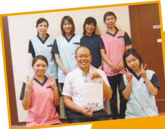
▲有限会社ロッシュ・ジャパンの皆さん

イクボスとは 職場で共に働く部下の仕事と生活の調和(ワーク・ライフ・バランス)を応援しながら、組織の業績も結果を出しつつ、自らも仕事と私生活を充実させている上司のことです。