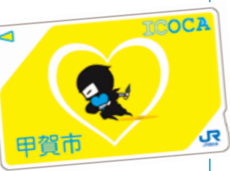
▲甲賀市オリジナルCOCAカード

草津線の利用促進やCOCAの普及啓発を目的として、今春小中学校を卒業される方に対して「甲賀市オリジナルCOCA」を給付します。平成31年3月に小中学校を卒業される市内在住の児童・生徒の方