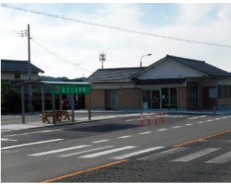
▲新しくなった近江土山駅舎の全景

平成29年度から、新名神高速道路を利用して土山から南草津駅までのコミュニティバス直通便を一日4往復運行し、大津・京阪神方面へのアクセスが充実しました。