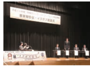
▲4事業所によるトークセッション

本事業の内部キーパーソン養成講座に参加いただいた甲賀市社会福祉協議会、(株)JAゆうハート、(株)種新と、市内でも特に先進的な取り組みをされている三陽建設(株)を加えた4事業所によるトークセッションが行われました。 三陽建設からは休みを取りにくい現場担当者も会社が主導して確実に休めるようにしている取り組みなどを紹介いただきました。