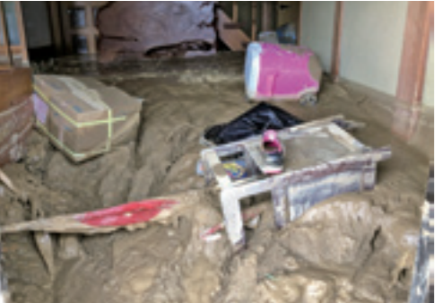
▲床上まで土砂が流入した玄関