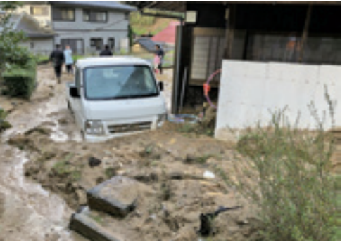
▲タイヤ部分が完全に埋まってしまい身動きが取れない軽トラック