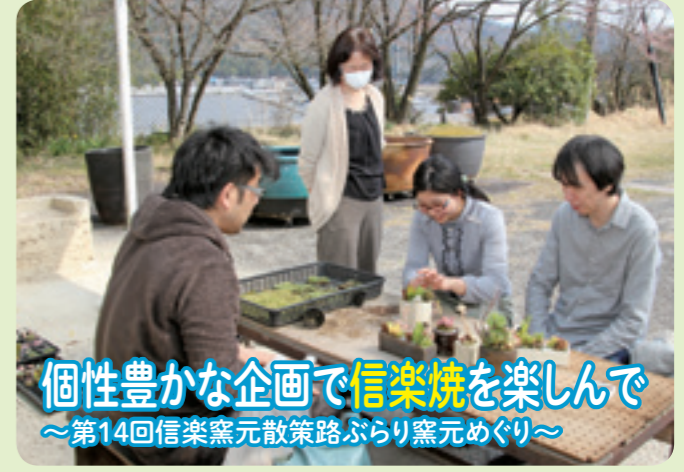
▲個性豊かな企画で信楽焼を楽しんで～第14回信楽窯元散策路ぶらり窯元めぐり～

「咲くや鮎河さくらまつり」が4月13、14日に土山町鮎河のうぐい川周辺で開催されました。春先の冷え込みで開花が遅れ、開催が1週間延期されましたが、13日は天候も良く、野洲川沿いや青土ダム周辺も合わせて約1600本の「鮎河千本桜」が満開を迎え、訪れた人々からは「きれい!」と歓声が上がっていました。