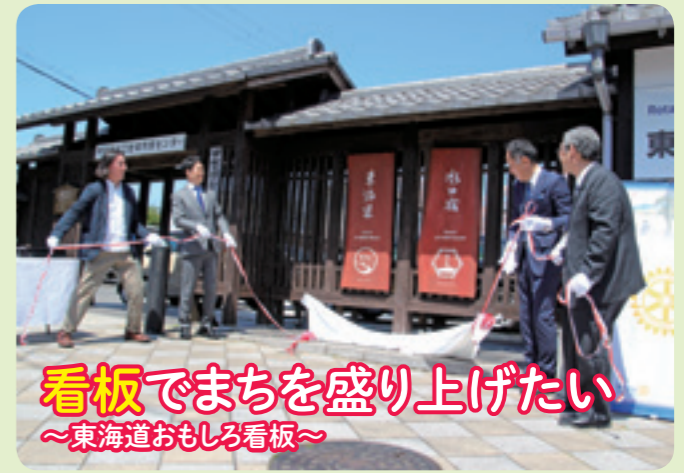
▲看板でまちを盛り上げたい～東海道おもしろ看板～

今年で14回目となる「ぶらり窯元めぐり」が4月5日から7日にかけて信楽窯元散策路で開催されました。21の窯元では、作陶や絵付けなどの体験型講座や作業場見学など、個性豊かな企画が用意されました。訪れた人は、窯元の方から話を聞いたり、気に入った器を購入したり、思い思いに信楽焼に触れ、窯元めぐりを満喫しました。