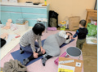
▲妊娠中の女性に向けた骨盤ケア

私自身、妊娠中にこんな記録のつけ方しておけばよかった、記念にこんなことしておけばよかったと思うことがあります。せっかく近くに妊婦さんたちがたくさんいるので、生まれてくる赤ちゃんを思いながらベビーグッズを作ったり、成長の記録を残したり、教室を通してつながり、みんな誕生を楽しみに待てたらいいなと思います。