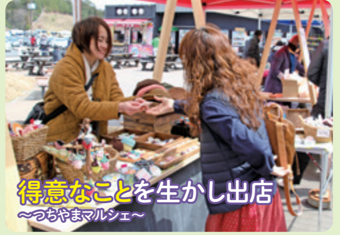
▲得意なことを生かし出店 ～つちやまマルシェ～

「つちやまマルシェ」が3月23日、土山サービスエリアにぎわい広場で開催されました。市内で起業をめざす女性のチャレンジショップを中心に手形アートや飲み物、手作り雑貨、木工雑貨など、それぞれの得意なことを生かした5つのブースが並びました。出店した人は「初めてサービスエリアで出店したが、想像以上にたくさんの人に見ていただけてうれしい」と話しました。