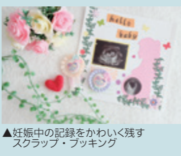
▲妊娠中の記録をかわいく残すスクラップ・ブック

市へ移住し、妊娠中は近くに友達がおらず、人とのつながりがなかったというメンバーもいて、そういった人の力になりたいと思いました。