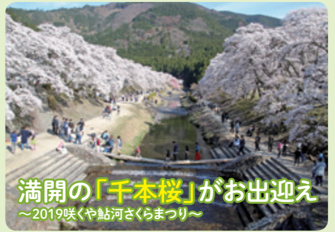
▲満開の桜の下でお花見や散策を楽しむ来場者

「つちやまマルシェ」が3月23日、土山サービスエリアにぎわい広場で開催されました。市内で起業をめざす女性のチャレンジショップを中心に手形アートや飲み物、手作り雑貨、木工雑貨など、それぞれの得意なことを生かした5つのブースが並びました。出店した人は「初めてサービスエリアで出店したが、想像以上にたくさんの人に見ていただけてうれしい」と話しました。