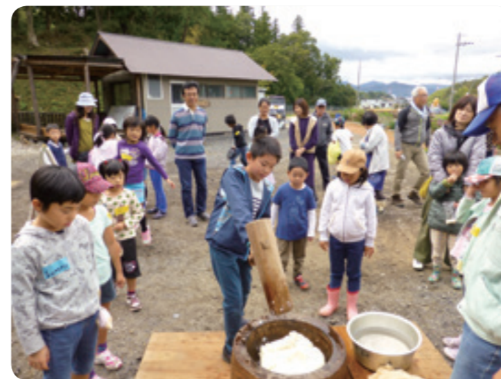
▲多世代との交流が図れる収穫祭

これは、現在耕作されていない遊休農地や、貸し農園を活用し、農作業による高齢者の健康づくりや生きがいづくりを推進し、人と人との交流を図ることで、結果として誰もが健康にいきいきと暮らせることを目的とした事業です。 今年度からはモデル事業として、既に利用実績のある市民農園「NPO法人 鹿深の杜」とタイアップし、市民農園を今後、市内全域にも拡大していく予定です。 また、将来的には市内の農家に呼びかけ、市民農園の開設者を増やすとともに、農地を活用したい方は、個人やグループなどでレクリエーション等の営利目的以外の農作業を楽しんでいただきます。