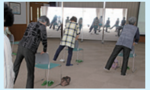
▲かえで会館にある移動式ミラー。ダンスや体操などにご利用いただけます。

開館日時 月～金の8時30分～17時15分 ※宇川会館およびかえで会館は、土曜日も開館しています。 ★児童館併設施設 (親子を対象とした事業あり)