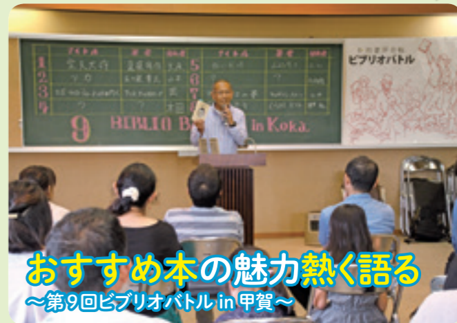
おすすめ本の魅力熱く語る ～第9回ビブリオバトルin甲賀～

今年は、9月に草津市で開催される音楽イベント「イナズマロックフェス」のキャラクター「タボくん」が描かれ、「タボくん」や「にんじゃえもん」も参加し、約400人が田植えをしました。