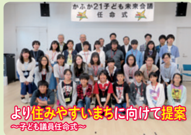
より住みやすいまちに向けて提案 ～子ども議員任命式～