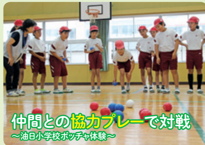
仲間との協力プレーで対戦 ～油日小学校ポッチャ体験～

と ころ 関宿街道沿い 臨時駐車場 関小学校グラウンド ※当日は交通規制が実施されるので、お車で越しの際はご注意ください。 問 い 合 わ せ 関宿祇園夏まつり実行委員会事務局(亀山市観光協会内) TEL 0595-97-8877