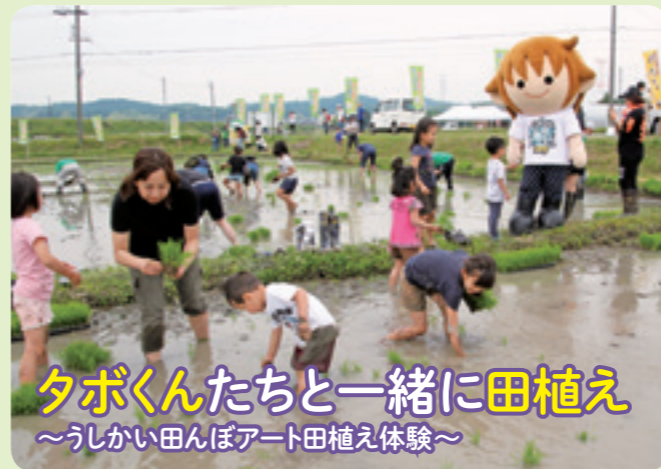
タボくんたちと一緒に田植え ～うしかい田んぼアート田植え体験～