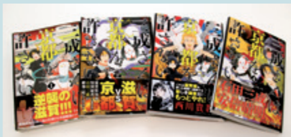
▲「三成さんは京都を許さない」(新潮社)全4巻

やらせていただけるならなんでもやりたいです。「三成さんは京都を許さない」の中で、甲賀流忍者のキャラクターや甲賀市のネタも描きました。まだまだネタの多い地域だと思っているので、機会があれば甲賀市をネタにした漫画なんかも描いてみたいですし、自分の描いた漫画が、アニメ化するのもひとつの夢です。