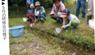
▲6月の研修会の様子