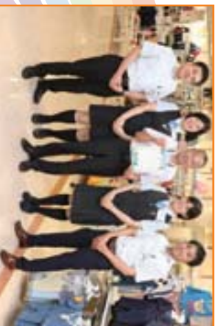
▲株式会社平和堂 アル・フラザ水口のみなさん

職場で共に働く部下の仕事と生活の調和(ワーク・ライフ・バランス)を応援しながら、組織の業績も結果を出しつつ、自らも仕事と私生活を充実させている上司のことです。