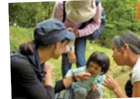
▲カナヘビを見つめる参加者