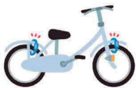
乗り物盗の被害状況 (6月末時点と比較)

令和7年になり、県下では1日平均約4台の自転車が盗まれています。甲賀市では減少傾向にありますが、自転車盗がなくなっているわけではありません。路上に放置したり、施錠せず停めたままにしていると簡単に盗まれてしまいます。自転車盗にあわないためにも外出時だけでなく、自宅に止めるときも常に自転車に鍵を掛けてください。