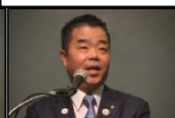
三日月滋賀県知事