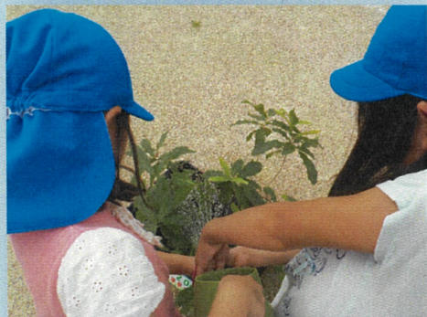
市内の保育園で園児も育てています