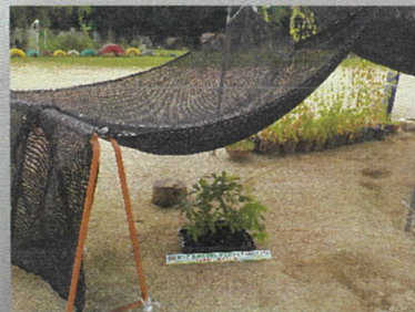
寒冷紗（かんれいしゃ）の下で育てている様

また、コンクリートやアスファルトなどの地面が熱くなりすぎるところでは、苗木の下にすのこを敷いたり、よしずで影を作るなどの対策をとってください。（極力このような場所は避けて地面において下さい。）