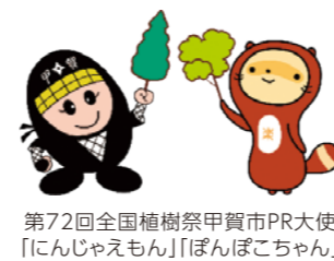
第72回全国植樹祭甲賀市PR大使 「にんじやえもん」「ぼんぼこちゃん」