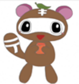
←甲賀市適応指導教室 マスコットキャラクター 「てき丸くん」

学校や家庭とは異なる 安心・安全な環境で、 いろいろな活動や体験を通して 子どもたちが自信や生きる力をつけ、 新しい一歩を踏み出すエネルギーを 蓄えていくところです。