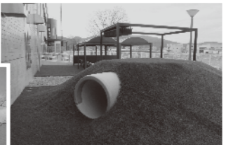
▲屋外遊戯場：築山 ◀別館側に専用の出入口があります。