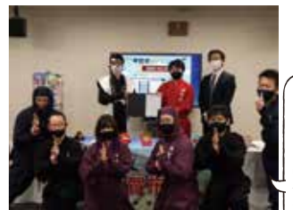
全員で忍者ポーズ! 株式会社シティコネクションの皆さん

ゲームに登場させたい名所や名物を募集します! 1.皆さんの身近にある名所や名物を教えてください! 2.ドット絵で表現されるため、複雑なものは表現できないことがあります。 3.採用された名所や名物は、今後発売予定のPC版「忍者じゃじゃ丸くん」に登場予定です。 4.当選者への発表は、ゲームへの登場をもってかえさせていただきます。 5.下記アドレスまで、名所や名物をご応募ください。 送付先: koka10041000@city.koka.lg.jp