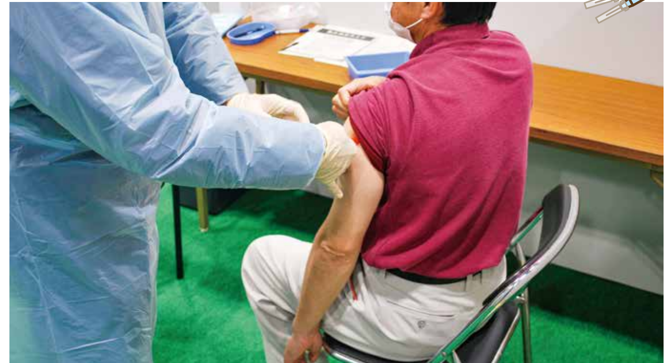
3月に実施した集団接種訓練