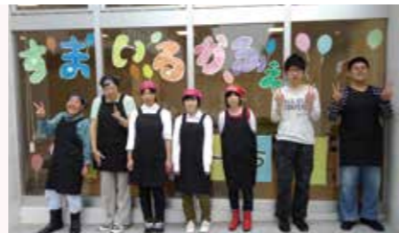
▲スタッフの皆さん