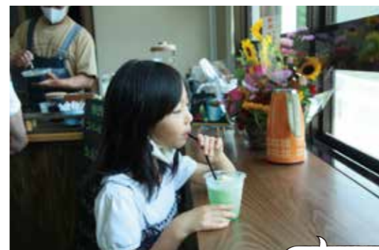
カフェを楽しむ来店者