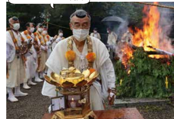
護摩供養の火から採火されるパラリンピックの元火