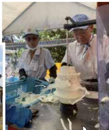
ユウガオの実をむく甲賀市シルバー人材センターの皆さん(水口町で)